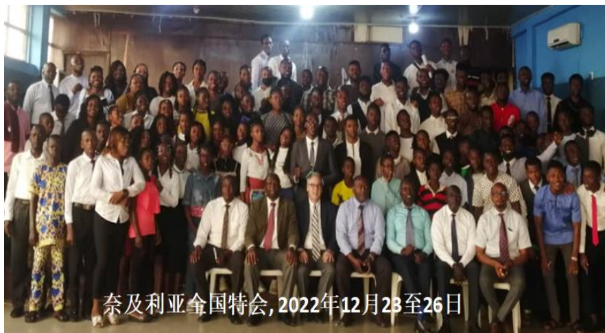
奈及利亚全国特会，2022年12月23至26日

由于疫情的缘故，过去三年没有举行大型的实体聚会。赞美主！在2022年12月恢复了实体的全国特会。这对圣徒是非常宝贵的相调和团聚的机会。这次特会的总题是「爱主并彼此相爱，为要生机的建造召会作基督生机的身体」。有338位来自奈及利亚各处召会的圣徒，还有18位来自贝宁共和国的圣徒来参加这次特会。