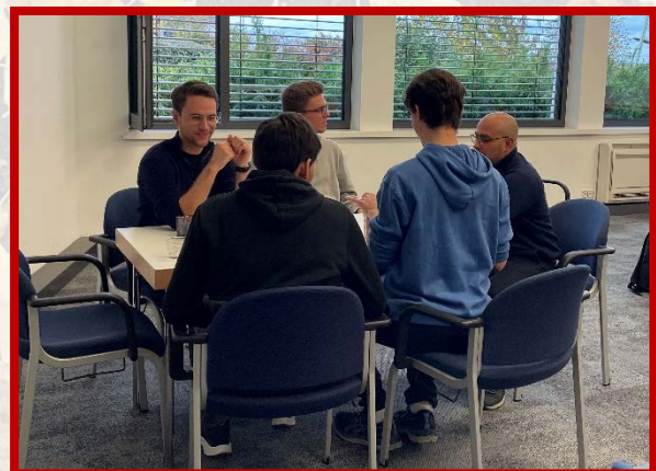
▲在身體的配搭中，與敞開新生有家聚會