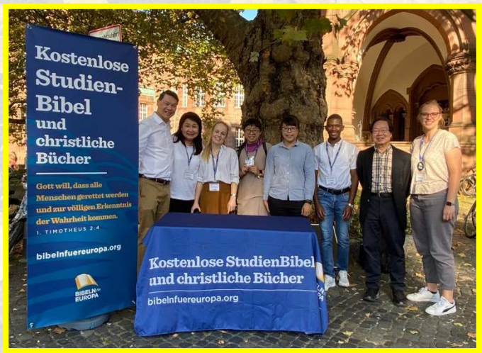
▲ 聖徒們一同配搭發送聖經