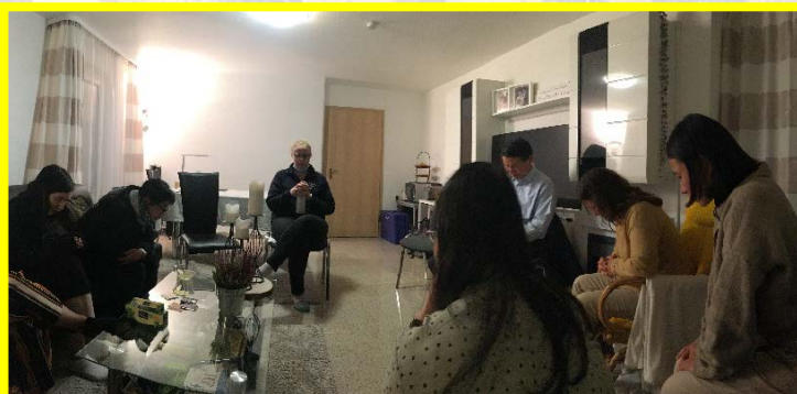
▲在聖徒家中的禱告聚會

開展期間，我們一同有分斯圖加特召會的禱告聚會，聚會中沒有特定的禱告項目，眾人來在一起，開頭便是禱告，在禱告中自然形成一道聖靈的水流，推動、加強並供應眾人。主也給眾人應時的話，將我們所接觸之人的光景顯明出來。在主日的擘餅聚集中，眾人用不同的語言唱詩禱告與讚美，使我們經歷祂突破一切種族、文化、語言、國籍的限制，讚美基督是一切，又在一切之內。