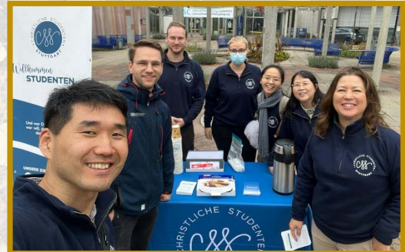
▲我們分別到斯圖加特的不同校區擺攤接觸人，在學聖徒與在職聖徒前來配搭

開展期間，我們一同有分斯圖加特召會的禱告聚會，聚會中沒有特定的禱告項目，眾人來在一起，開頭便是禱告，在禱告中自然形成一道聖靈的水流，推動、加強並供應眾人。主也給眾人應時的話，將我們所接觸之人的光景顯明出來。在主日的擘餅聚集中，眾人用不同的語言唱詩禱告與讚美，使我們經歷祂突破一切種族、文化、語言、國籍的限制，讚美基督是一切，又在一切之內。