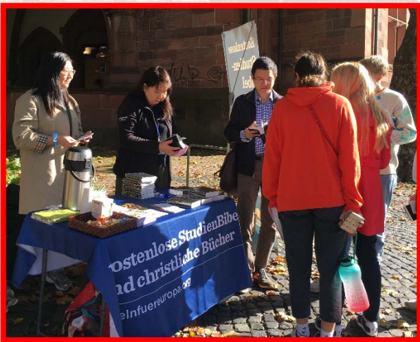
▲ 在弗萊堡大學附近擺攤接觸學生

在弗萊堡，聖徒配搭人數不多，甚至有些狀況—語言的限制、文化的差別、配搭的確診、天候的不佳，車禍的事故，還有不同的團體試圖破壞向我們敞開的學生...等。每天開展結束後，我們分別時間為着當天的開展有敞開的交通與為人題名的禱告。我們的主是得勝的！我們運用祂屬天的權柄，捆綁那惡者及其一切的作為，為神的權益得着建造的材料禱告。我們確信不是主『為我們』的開展行動作甚麼，而是主親自『為祂自己』的需要而作事。主的確在祂的行動裏祝福這地，儘管有許多為難，但仍有平安之子加給我們。