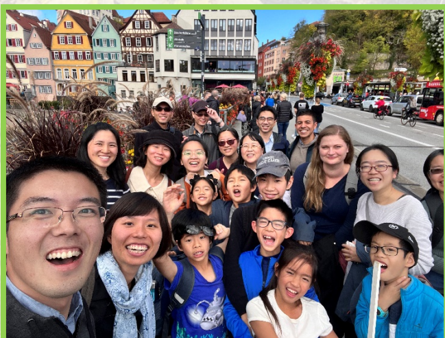
▲聖徒們在街上喜樂的唱詩，並發送聖經

第二週，我們分別前往圖賓根、弗萊堡兩個城市。圖賓根是個大學城，人口百分之三十是圖賓根大學的學生，各學院就坐落在城市的每個角落。圖賓根召會於今年九月二十五日設立。當地有五個移民的家，還有一位本地的青職姊妹，和幾位留學生。圖賓根召會在召會生活的實行上都是新的，如社團擺攤、聖徒配搭在大街上唱詩並發送福音單張與聖經。非常珍賞他們向着主的單純，享受召會生活的新鮮，以及對人有真實的關切。在每日開展前的交通，弟兄們總會說：『Ok, Let's talk about our learning yesterday.』這不是為了檢討眾人作工的成效如何，而是關切我們在過程中學到甚麼？有哪些方面是能再往前的？在交通中，我們花許多時間談所接觸之人的情形，關心他們是否都有第一次的家聚會，後續有誰能配搭牧養他們。藉着這樣扎實的談人事奉，就能使他們成為常存的果子。