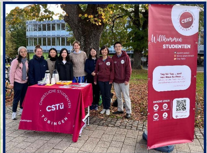
▲社團第一次在校園擺攤