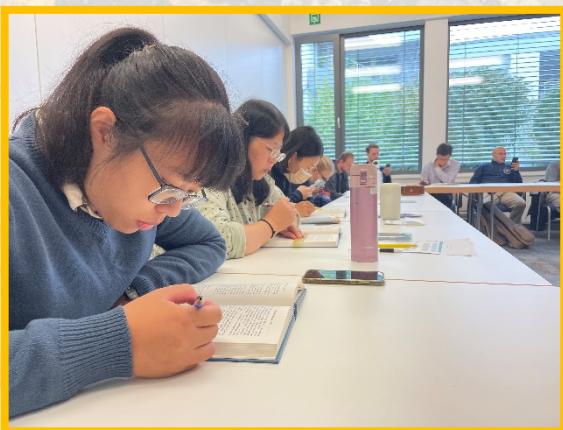
▲開展前一同享受主話的加強與供應

每日早晨，在開展前的交通，我們唱詩、禱告，眾人生機的點詩、禱讀、禱告，讓聖靈能自由的在我們中間流通運行。校園開展是以社團名義擺攤為主，擺上咖啡、可可和一些點心，邀請學生前來享用，並抓住時機與人有一些談話。要得着一個德國人的名單十分不易，需要與他們有長時間的談話，讓他們了解我們後，纔有可能彼此交換聯絡的方式。這一談，也許就要半小時到一小時不等，有時甚至要花更多的時間。看似為難，但我們仍仰望主，在開展時，為着我們所接觸的人題名代禱，我們關心這些名單背後一個又一個的人，必須是『關鍵的人』—只要得着一個關鍵的德國人，這個德國人就能再得着另一個德國人。