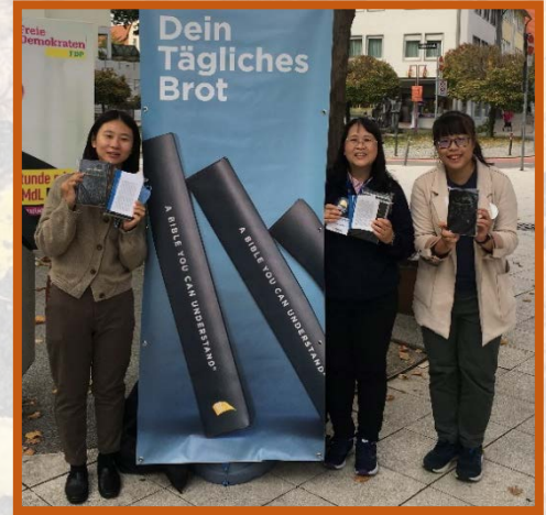
▲我們竭力與人分享恢復本聖經中寶貴的綱要與註解，有分主在歐洲之真理的推廣