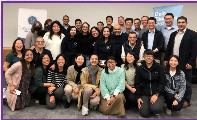
▲來自各地的聖徒，一同有分主在斯圖加特的行動

這次開展隊有九位來自不同國家的弟兄姊妹，一同與當地聖徒配搭、相調。我們的開展目標是要得着當地的青年人，甚至得着『關鍵的人』，以及加強當地聖徒在神命定之路的實行。