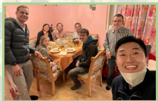
▲在聖徒家晚餐相調：藉著唱詩和交通，眾人就在基督裏失去一切的區別